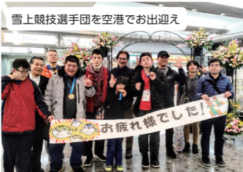
雪上競技選手団を空港でお出迎え