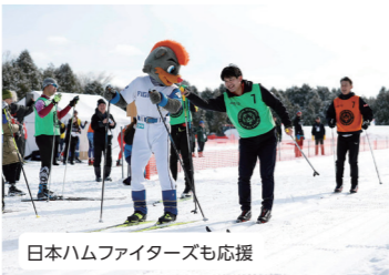
日本ハムファイターズも応援