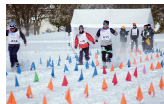
スノーシューイング