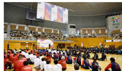
フロア競技開会式