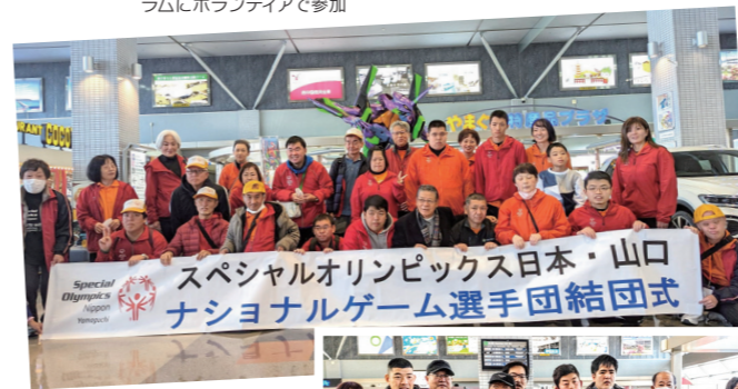
フロア競技選手団、宇部空港から出発