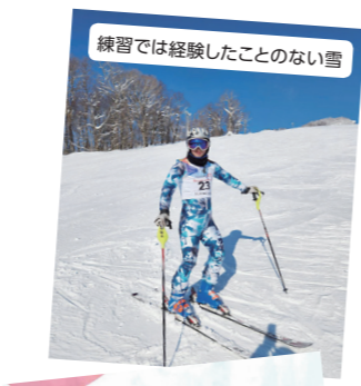
練習では経験したことのない雪