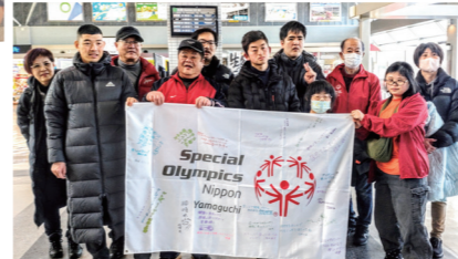
雪上競技選手団、みんなからの寄せ書きを手に出発