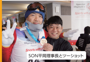
SON平岡理事長とツーショット