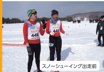
スノーシューイング出走前