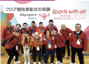
フロア競技表彰式の写真 Sports with all Nippon NATIONAL WINTER GAMES 2024