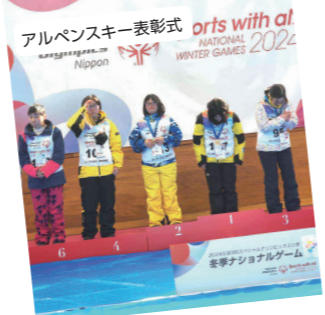
アルペンスキー表彰式 Sports with all Nippon NATIONAL WINTER GAMES 2024