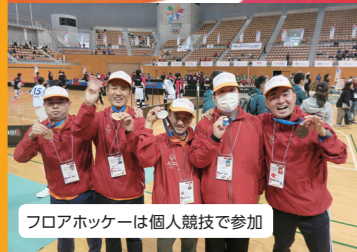
フロアホッケーは個人競技で参加