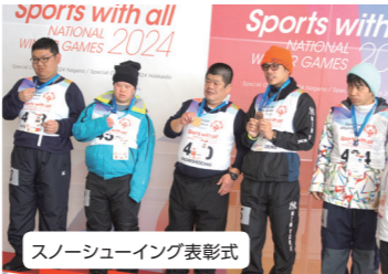
スノーシューイング表彰式