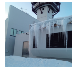
外はこんな感じです